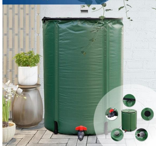
Složitelné sudy pro sběr dešťové vody

Do sortimentu jsme nově zařadili složitelné sudy pro sběr dešťové vody. Sud lze složit snadno do 5 minut. V nabídce naleznete provedení o objemu 200 l (typ: 8220) nebo 500 l (typ: 8221) . Menší provedení je vybaveno kohoutkem s možností připojení zahradní hadice a větší provedení je pak vybaveno dvěma kohoutky, jedním pro připojení hadice a druhým pro stáčení vody. Sudy jsou v horní části opatřeny otvorem pro plnění se sítkou chránící před vniknutím nečistot. Jsou také opatřeny vnitřními filtry, otvorem proti přeplnění a díky hornímu otvoru není vyžadováno sud připojovat k okapovému svodu.