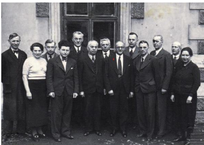
Skupinová fotografie administrativních pracovníků Mevy (rok 1934)

Závod v Roudnici nad Labem, dnes považovaný za srdce celé společnosti, byl zařazen na seznam provozů určených k likvidaci. Vedení firmy se rozhodlo postupně utlumit činnost a přesunout aktivity jinam. Málokdo tehdy věřil, že by Roudnice mohla mít v budoucnu nějakou větší průmyslovou perspektivu.